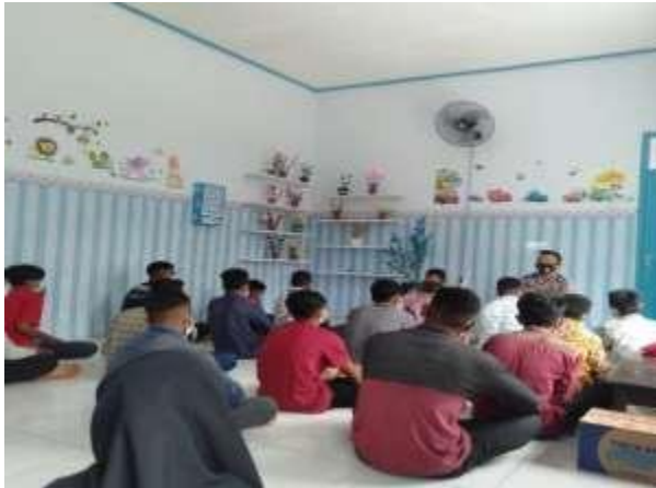
Gambar 3.1 Pelaksanaan Pengabdian I

Aktivitas pengenalan rambu lalu lintas dengan memperlihatkan bentuk dan makna seperti :