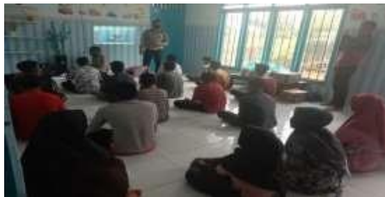
Gambar 3.2 Pelaksanaan Pengabdian II

Pemaparan singkat yang dilakukan oleh narasumber diselingi oleh pengabdi dengan memberikan ice breaking juga membantu peserta sosialisasi lebih rileks dan antusias dalam mengikuti kegiatan sosialisasi.