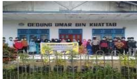
Gambar 3.4 Pelaksanaan Pengabdian VI

yang ditunjukkan. (2) Peserta mempraktekkan bagaimana jika berada pada situasi di jalan apabila hendak menyebrang jalan dengan memperhatikan, pertama menoleh kekanan dan kekiri berguna untuk memastikan kendaraan yang melintas, kedua jika melihat zebra cross maka menyeberanglah dengan melaluinya dan tetap memperhatikan ketentuan pertama, ketiga menyeberanglah pada saat kendaraan mulai lengang, keempat dalam aktivitas di jalan agar selalu waspada dan tetap terus berhati-hati.