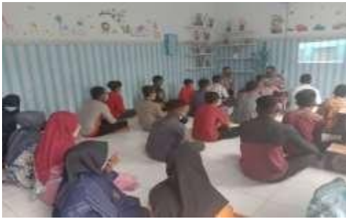
Gambar 3.3 Pelaksanaan Pengabdian III

Dijabarkan secara jelas kepada peserta sosialisasi mengenai perbedaan antara kejahatan dan pelanggaran, yakni kejahatan sering disebut sebagai delik hukum, artinya sebelum hal itu diatur dalam undang-undang, sudah dipandang sebagai seharusnya dipidana, sedangkan Pelanggaran sering disebut sebagai delik undang-undang, artinya dipandang sebagai delik karena tercantum dalam undang-undang. Berikut rangkum perbedaan antara Kejahatan dengan Pelanggaran: