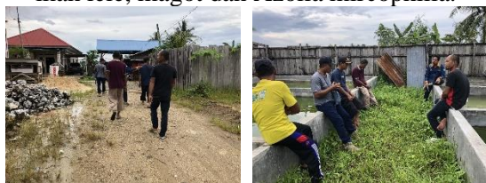
Gambar 2.1. Koordinasi bersama lurah dan kelompok pembudidaya lele