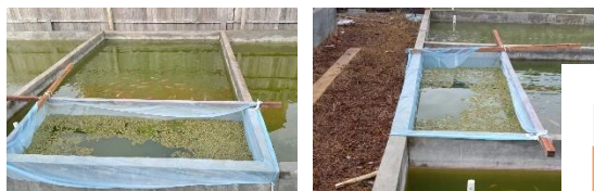
Gambar 2.3. Pengembangan Azolla microphylla

Secara garis besar metode pelaksanaan dapat digambarkan dalam skema berikut: