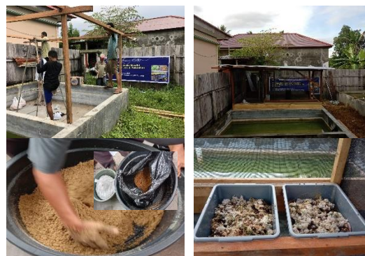
Gambar 2.2. Pembuatan kandang budidaya maggot BSF dan proses budidaya maggot BSF

Pada tahap ini, mitra dilatih dan didampingi dalam pembuatan rumah budidaya maggot BSF sebagaimana rencana yang telah dibuat oleh tim pengabdian. Setelah rumah budidaya maggot selesai dikerjakan, kemudian mitra dilatih untuk memancing lalat BSF dari alam, menetasakan telur lalat BSF, merawat bayi larva, merawat larva maggot hingga menjadi pra pupa, menetasakan pupa maggot menjadi lalat BSF dewasa untuk kemudian dijadikan sebagai indukan untuk budidaya maggot dan memindahkannya pada kandang khusus lalat dewasa yang telah disiapkan. Siklus budidaya maggot diulang dengan kegiatan pemancingan cukup di kandang lalat yang telah dibuat, dan maggot yang dihasilkan sebagian digunakan sebagai pakan serta sebagian lainnya diletakkan kembali untuk ke siklus budidaya selanjutnya. Pada tahap ini juga dilakukan pelatihan dan pendampingan pengolahan sampah organik rumah tangga sebagai pakan larva maggot BSF.