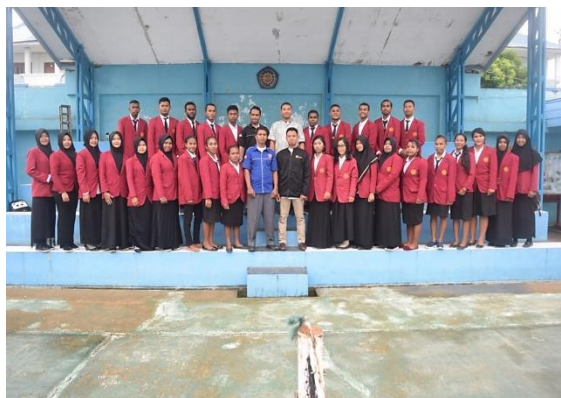
Gambar 1. Penerjunan Mahasiswa