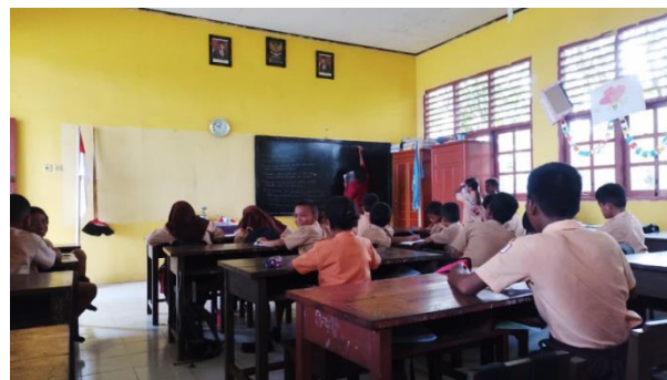
Gambar 3. Asistensi Mengajar

Kegiatan pelaksanaan program pada kegiatan asistensi mengajar adalah mahasiswa menyiapkan rencana pelaksanaan pembelajaran dan membuat media pembelajaran yang sesuai dengan materi yang diajarkan. Kegiatan pelaksanaan asistensi mengajar ini dilaksanakan selama 8 minggu. Masing-masing dosen pendamping lapangan berkewajiban melaksanakan penilaian sebanyak 3x di sekolah mitra.