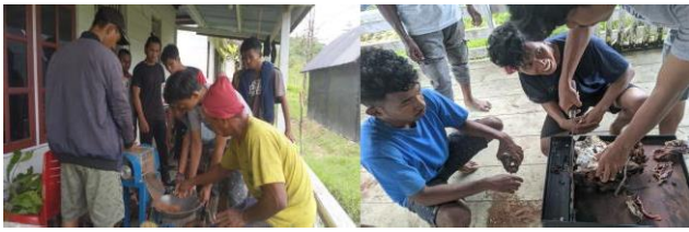
Gambar 2 Pelaksanaan Program