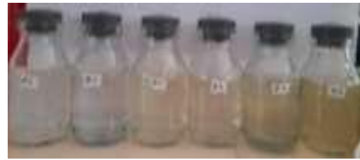
Gambar 4. Sampel air dengan variasi pH

Berdasarkan perubahan warna sampel seperti pada gambar 2, dapat diketahui massa absorbennya dari perbedaan warna tiap variasi massa, dimana variasi 50mg merupakan variasi dengan warna paling bening atau cerah, sedangkan sampel warna dari variasi massa lainnya menunjukkan kekeruhan. hidrogen yang terdapat dalam larutan relatif sedikit sehingga gugus aktif yang terdapat pada absorbennya akan mudah berikatan dengan logam besi. Akan tetapi pada pH 3-5 yang terletak pada nilai absorbansinya memiliki kesamaan, hal ini dikarenakan Fe yang tertinggal dalam sampel sangat sedikit serta sampel yang terbaca pada Spektrofotometer UV-Vis adalah dalam bentuk senyawa yang didalamnya bukan hanya Fe saja yang terbaca nilai absorbansinya, karena Spektrofotometer UV-Vis menggunakan prinsip kerja dengan intensitas warna sampel yang terserap. Hal ini dapat dilihat pada gambar 4, dimana warna pH 3-5 memiliki warna lebih jernih dari pH yang lainnya.