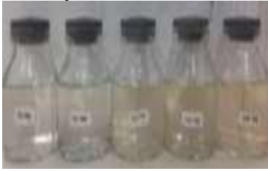
Gambar 2. Sampel air dengan variasi massa

mengandung Fe serta adanya penambahan \text{HNO}_3 sebanyak 1 ml dan KCNS 3 ml.