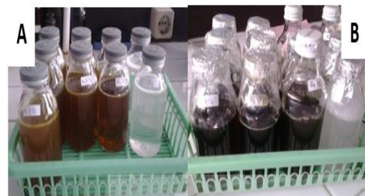
Gambar 1. Obat kumur sebelum (A) dan setelah Cycling test (B)