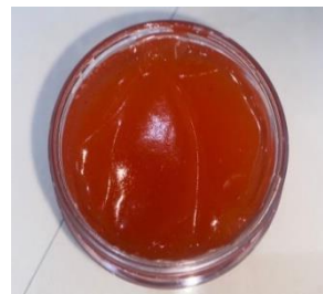
Sediaan gel sunscreen