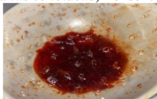
Gambar 1. Ekstrak etanol buah merah ( Pandanus conoideus )

Ekstrak kental yang dihasilkan dari hasil pemekatan adalah sebanyak 154,5 gram dari simplisia kering yang digunakan sebanyak 1000 gram sehingga menghasilkan rendemen ekstrak 15,45 %. Ekstrak kemudian diformulasikan menjadi sediaan gel sunscreen dengan konsentrasi 10 % sesuai dengan takaran yang telah ditentukan sebelumnya, sehingga didapat hasil sediaan gel sunscreen ekstrak etanol buah merah dengan konsentrasi 10 %.