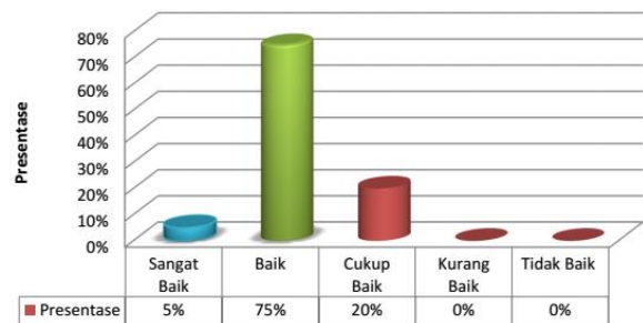
Gambar 1. Grafik persentase skor kategori motivasi orang tua

Dari data tabel di atas dapat dilihat persentase skor kategori motivasi orang tua yang menunjukkan bahwa mayoritas siswa sudah mendapatkan motivasi yang baik dari orang tua untuk menunjang hasil belajar yang baik. Lebih jelasnya dapat dilihat pada gambar 1.