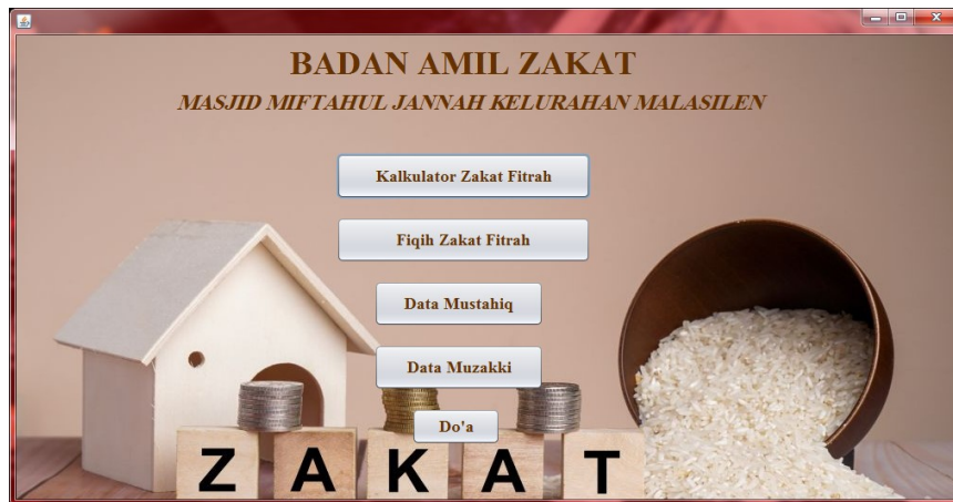
Gambar.3 Menu Utama Sistem Pengelolaan Zakat Fitrah

Ujicoba yang dilakukan untuk mengukur kelayakan sistem informasi pengelolaan zakat fitrah pada BAZ Masjid Miftahul Jannah yang telah di rancang menggunakan pengujian blackbox . Pengujian blackbox dilakukan dengan menilai seluruh fungsional. Metode pengujian menekankan pada menjalankan fungsi dan pemeriksaan input dan data output dari sistem informasi pengelolaan zakat fitrah pada BAZ Masjid Miftahul Jannah di Kelurahan Malasilen. Fungsi, input dan data output tersebut adalah layout menu utama, layout menu kalkulator zakat fitrah, layout menu fiqih zakat fitrah, layout menu data Mustahiq dan Muzakki, juga menu layout Do'a. Setelah melalui proses pengujian blackbox oleh ahli sistem berikutnya ujicoba akan di lakukan dengan melakukan validasi sistem informasi pengelolaan zakat fitrah berbasis J2SE terhadap ahli serta pengujian langsung oleh pengguna dengan skala besar minimal 30 orang responden.